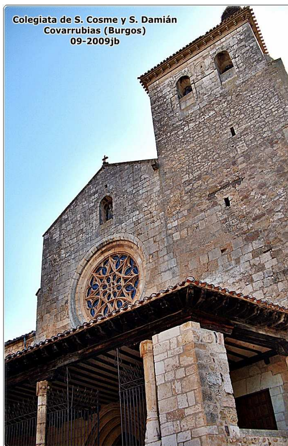
Colegiata de S. Cosme y S. Damián Covarrubias (Burgos) 09-2009jb

mudéjares, tres naves, crucero y cuatro capillas laterales; un claustro que fue añadido en S. XVI; un órgano del S. XVII (el más antiguo de Castilla que sigue sonando) y magníficos altares barrocos del S. XVIII. Aquí están enterrados, entre otros, Fernán González y su esposa Da Sancha, en sarcófagos romanos del S. IV originarios de Clunia; la princesa Cristina en sepulcro gótico y las familias más ilustres de la villa.