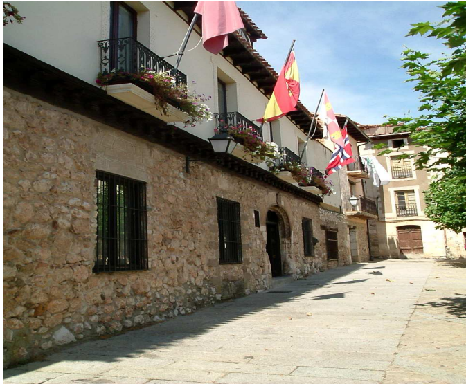
Palacio de Fernán González S. XII, románico, hoy es el Ayuntamiento de Covarrubias.