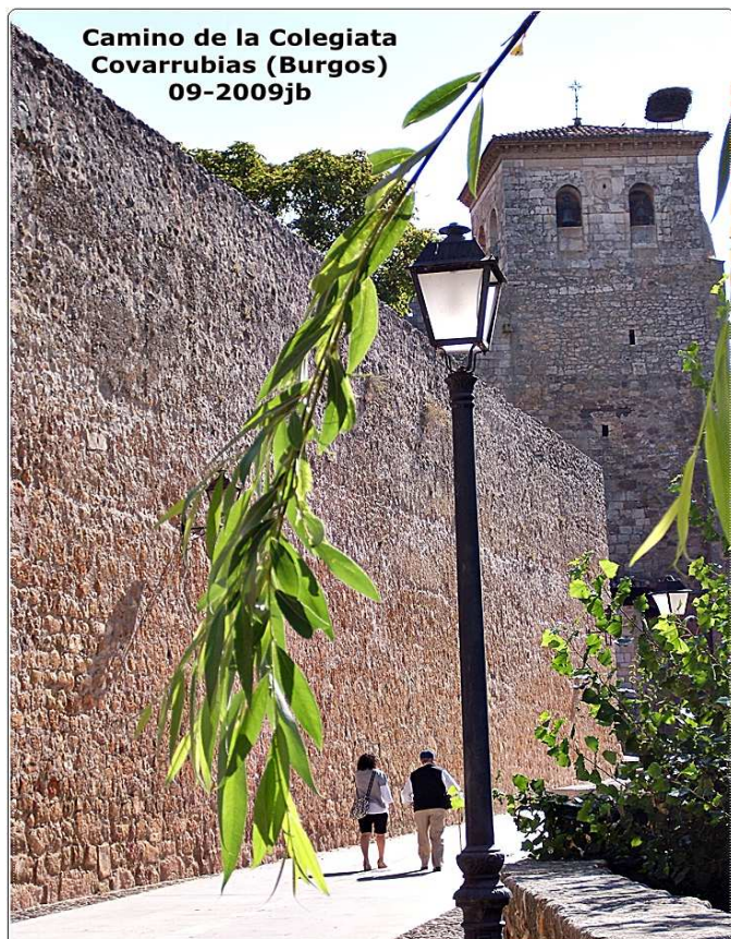
Camino de la Colegiata Covarrubias (Burgos) 09-2009jb

La torre de La Emparedada es construcción mozárabe del S. X de carácter defensivo, donde se dice, se cuenta, se rumorea que D a Urraca fue emparedada por su propio padre, Fernán González.