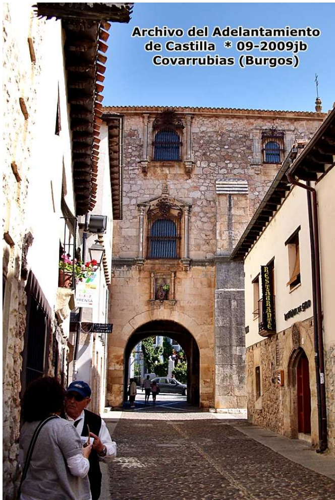
Archivo del Adelantamiento de Castilla * 09-2009jb Covarrubias (Burgos)

Renacentista del S. XVI atribuido a Juan de Herrera y terminada por Juan de Vallejo. Mandado construir por Felipe II en honor a su médico el Dr. Vallés, nacido en Covarrubias en el año 1524, y protagonista del alivio en su enfermedad de gota. Conocido por el Divino Vallés , fue el autor del derribo de las murallas de Covarrubias con el fin de hacer que corriese el viento por el pueblo y combatir la peste que padecían. En el S. XVIII dejó de ser archivo de documentos al pasar a Simancas, pasó a ser ayuntamiento y hoy lo tenemos como oficina de Información y Turismo, Biblioteca Municipal y Sala de Exposiciones. Las rejas de las ventanas son las originales.