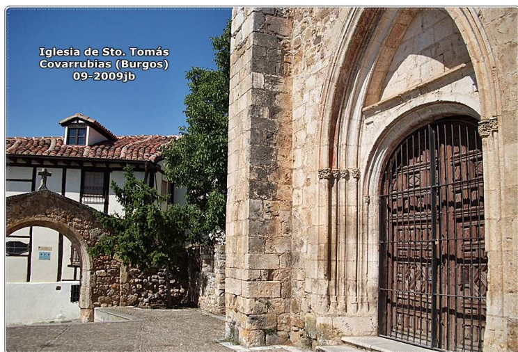
Iglesia de Sto. Tomás Covarrubias (Burgos) 09-2009jb

Estilo gótico del S. XV y reformada en el S. XVIII con predominio barroco. Su antiguo origen es del S. XII con su pila bautismal románica, la escalera plateresca, la vidriera renacentista que representa la natividad y su colección de retablos.