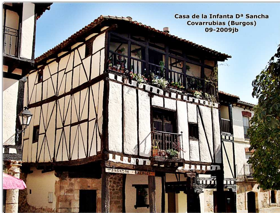
Casa de la Infanta D a Sancha Covarrubias (Burgos) 09-2009jb