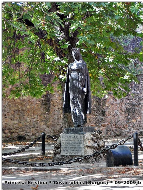
Princesa Kristina * Covarrubias (Burgos) * 09-2009jb

Recomiendo pasear por sus empedradas calles y disfrutar con su atractivo barrio antiguo de casas con armazones de vigas de madera soportadas por columnas de piedra y cruceros góticos decorando el pueblo.